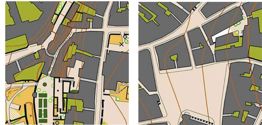
Kartta: ISSOM standardi, mittakaava 1:4000, käyräväli 2,0 m, kartoitetaan uudestaan vuodeksi 2016.

on loistava sprinttimaasto, joka tarjoaa mielenkiintoisia reitinvalintahaasteita.