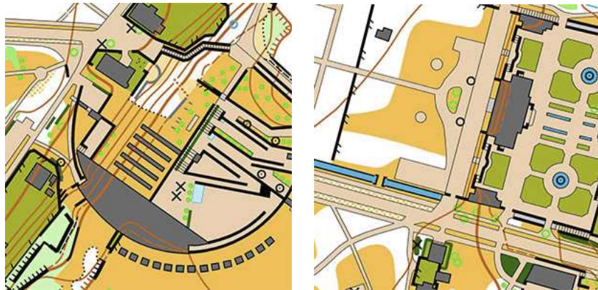
Kartta: ISSOM standardi, mittakaava 1:4000, käyräväli 2,0 m, kartoitetaan uudestaan vuodeksi 2016.

Kadriorgin puisto on Viron näyttävien palatsi- ja kaupunkipuisto. Puistossa on laajoja viheralueita ja kanaaleja. Maastossa on paljon teitä ja polkuja. Suurin korkeusero on 25 m. Alueella sijaitsee useita turistikohteita.